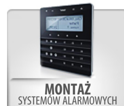
MONTAŻ SYSTEMÓW ALARMOWYCH