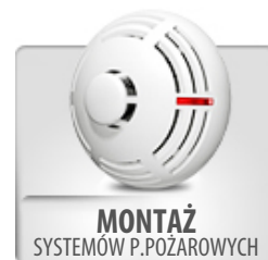
MONTAŻ SYSTEMÓW P.POŻAROWYCH