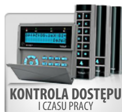
KONTROLA DOSTĘPU I CZASU PRACY