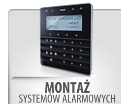
MONTAŻ SYSTEMÓW ALARMOWYCH