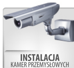
INSTALACJA KAMER PRZEMYSŁOWYCH