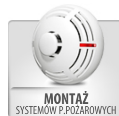
MONTAŻ SYSTEMÓW P.POŻAROWYCH